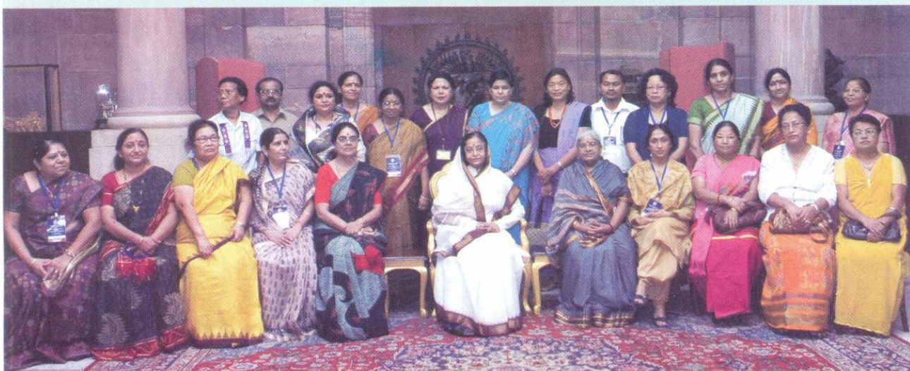
डॉ. गिरिजा व्यास और राज्य आयोगों की अध्यक्षाएँ राष्ट्रपति श्रीमती प्रतिभा पाटिल के साथ

क्रियान्वयन के लिए एक राष्ट्रीय मिशन स्थापित किया जा रहा है। आयोग को सभी स्तरों पर जागरूकता पैदा करनी चाहिए। उन्होंने कहा कि महिलाओं को हिंसा और शोषण सहन नहीं करना चाहिए और उनके अधिकारों की लड़ाई प्रत्येक स्तर पर एक अखिल भारतीय आंदोलन के रूप में लड़ी जानी चाहिए।